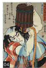
04 歌川 国芳「国芳模様正札附 現金男 団七九郎兵衛」 358×243mm・1845(弘化2)年頃