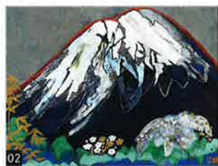
02 片岡 球子「めでたき富士」 日本画・310×400mm・ 東京美術倶楽部鑑定書