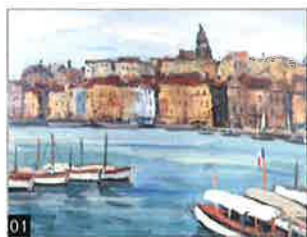
01 荻須 高徳 「マルセーユ」 油彩画・4号F・ 東京美術倶楽部鑑定書

国内・海外の名品をご紹介します「ファインアート展」第1週は、日本画の巨匠の名作や古典作品などバリエーション豊かにご紹介いたします。