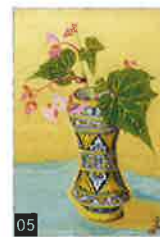
05 小倉 遊亀「花」 日本画・557×380mm・ 共シール 小倉健一鑑定書