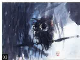
03 棟方 志功「みみずく図」 倭画・302×417mm・ 棟方志功鑑定委員会鑑定登録証